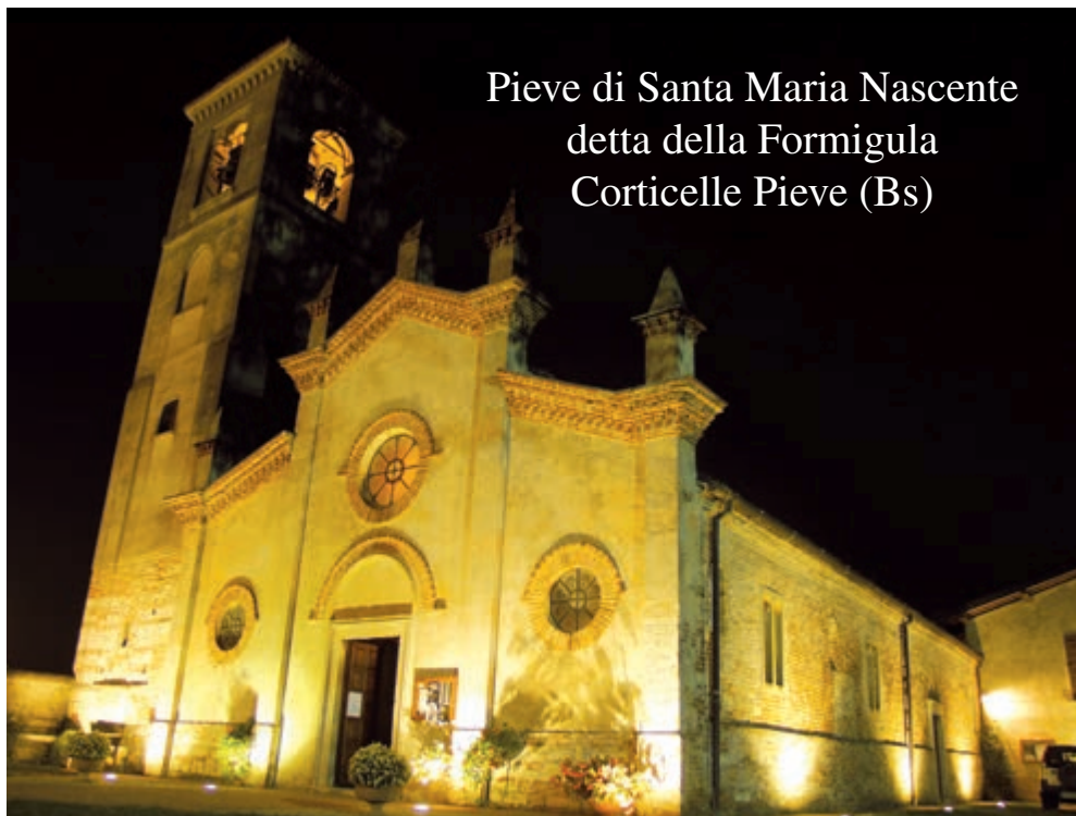
Pieve di Santa Maria Nascente detta della Formigula Corticelle Pieve (Bs)

La nostra sede e a Corticelle Pieve (Bs) in via Manzoni www.amicidellapieve.org - info@amicidellapieve.org