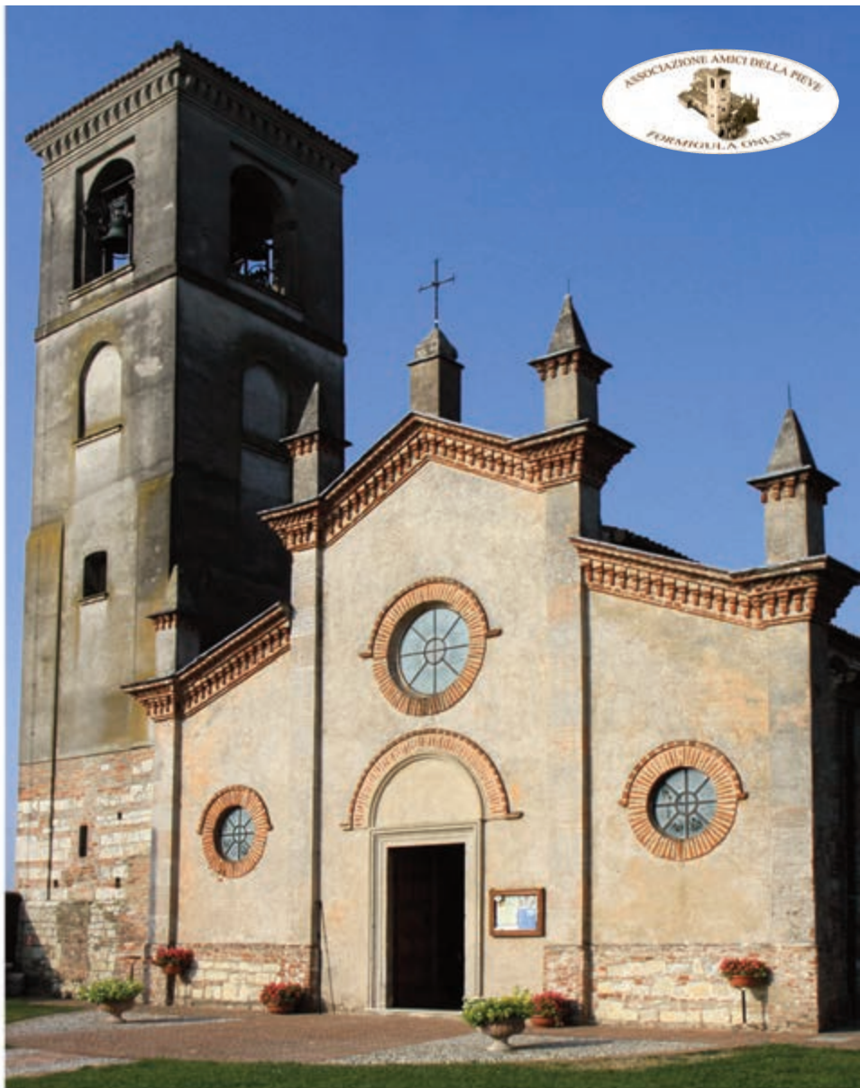
PIEVE SANTA MARIA NASCENTE DETTA DELLA FORMIGOLA CORTICELLE PIEVE - BRESCIA