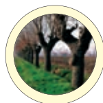
Associazione Comuni Terre Basse